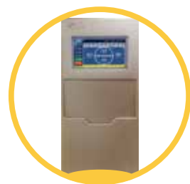
7寸真彩触摸屏 一体式设计插页框